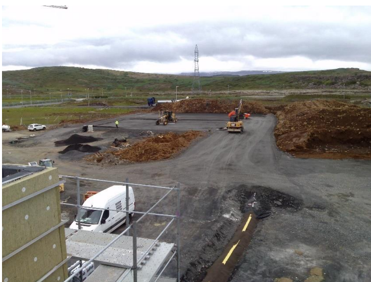
Svæði sunnan hússins.