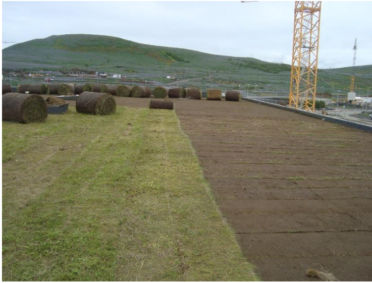
Hús C, unnið í efra lagi torfs á þaki.