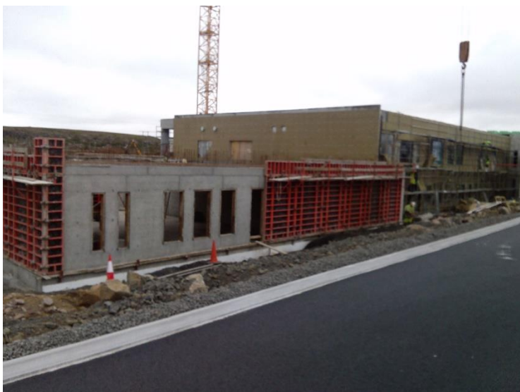
Hús C og D