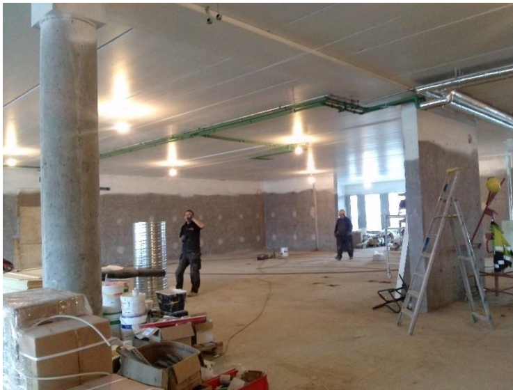
Hús B, unnið við pípulagnir.