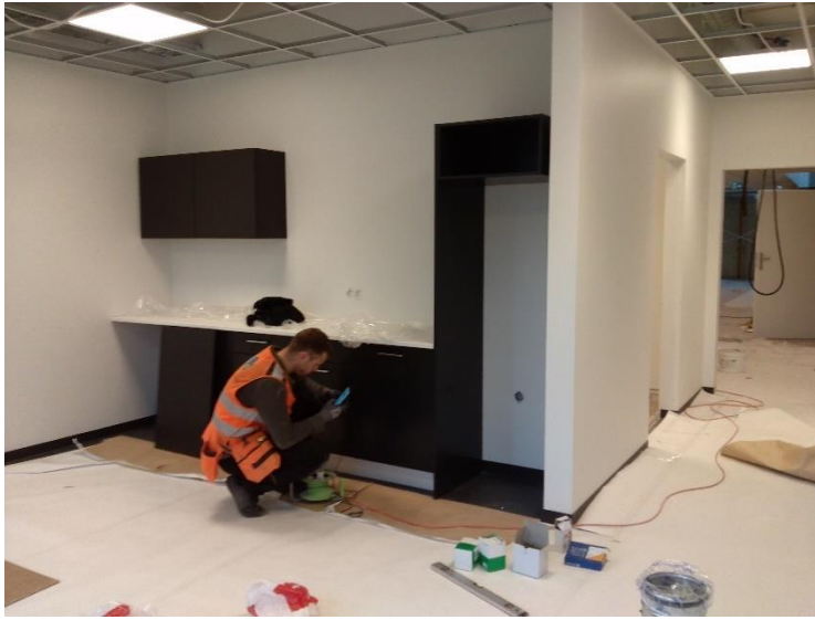
Hús C, uppsetning innréttinga á 1.h.