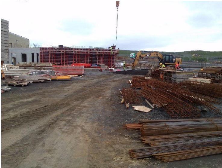
Hús D og E