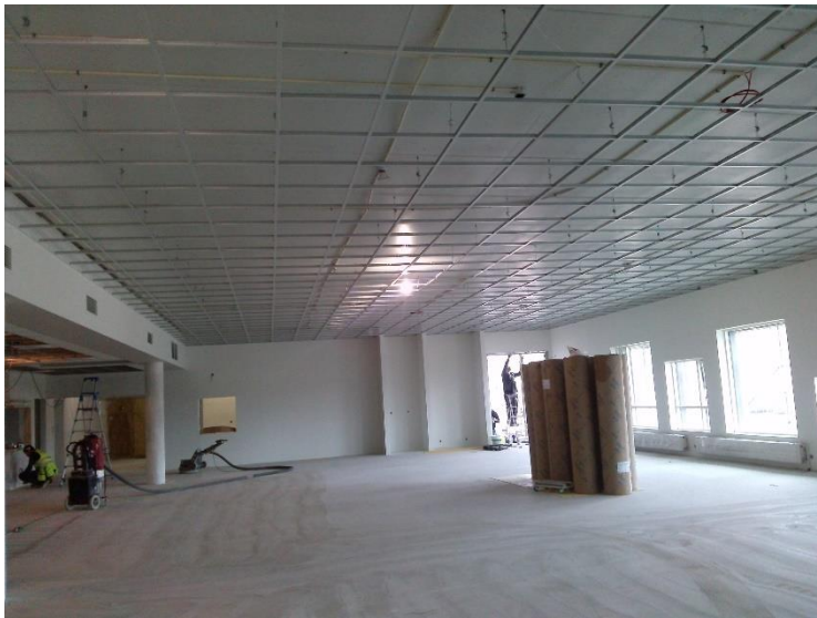
Hús C, kerfisolft og málningarvinna á 2h.