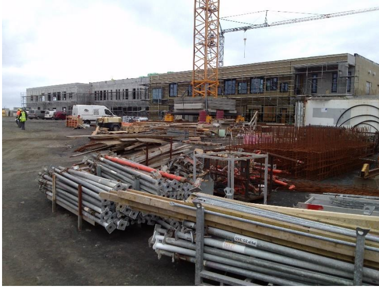
Hús A, B, C og D