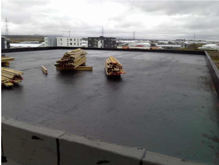
Hús A, uppsteipt, grunnað þak.