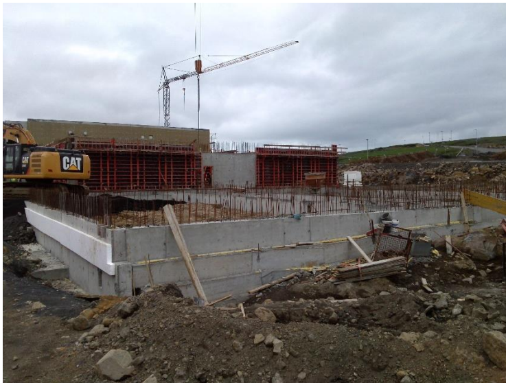
Hús E, fylla inn í sökklá