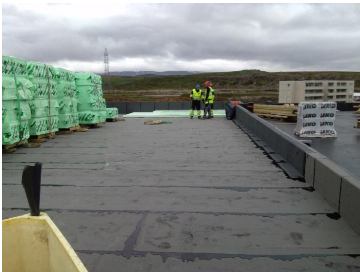
Hús B, Pappalögn að klárast og byrjað á einangrun.